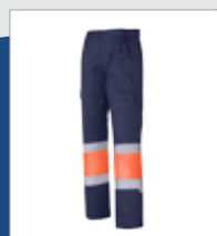
032 Marino/ Naranja AV