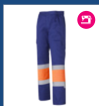
042 Azulina/ Naranja AV