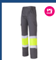
051 Gris/ Amarillo AV