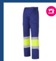
041 Azulina/ Amarillo AV