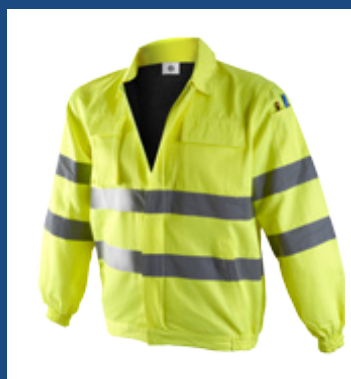
001 Amarillo AV