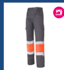
052 Gris/ Naranja AV