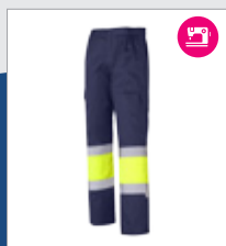
031 Marino/ Amarillo AV