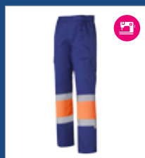
042 Azulina/ Naranja AV