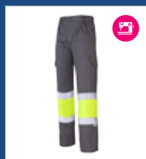
051 Gris/ Amarillo AV