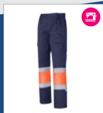
032 Marino/ Naranja AV