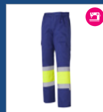
041 Azulina/ Amarillo AV