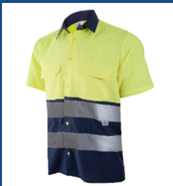
031 Marino/Amarillo AV