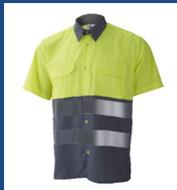
051 Gris/Amarillo AV