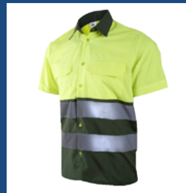
091 Verde oscuro/Amarillo AV