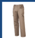
012 Beige DESCATALOGADO (últimas unidades)