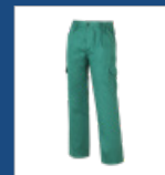
008 Verde DESCATALOGADO (últimas unidades)