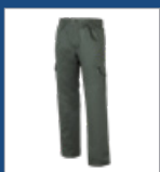
009 Verde oscuro