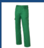
010 Verde medio DESCATALOGADO (últimas unidades)