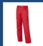
013 Rojo DESCATALOGADO (últimas unidades)