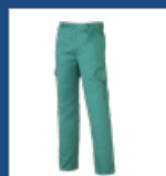
011 Verde claro