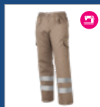
012 Beige DESCATALOGADO (últimas unidades)