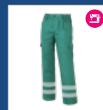
008 Verde DESCATALOGADO (últimas unidades)