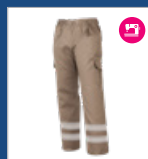
012 Beige DESCATALOGADO (últimas unidades)