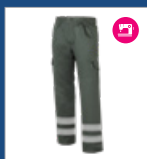
009 Verde oscuro