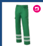
010 Verde medio DESCATALOGADO (últimas unidades)