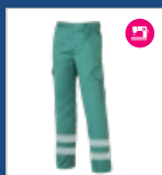
011 Verde claro