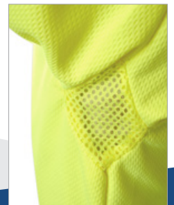
Detalle de las axilas