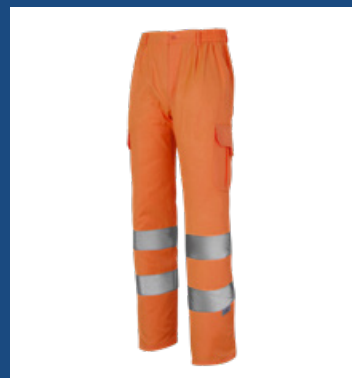
002 Naranja AV