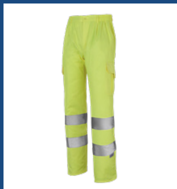
001 Amarillo AV