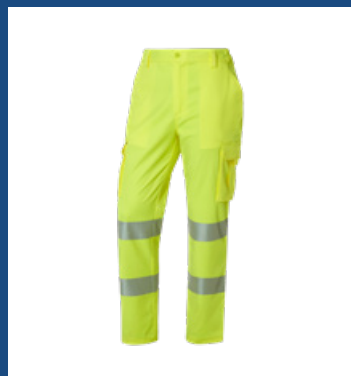
001 Amarillo AV