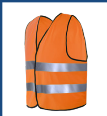
002 Naranja AV