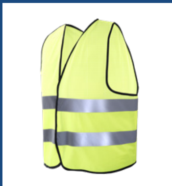
001 Amarillo AV