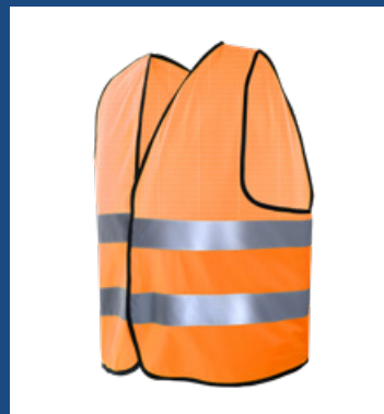
002 Naranja AV