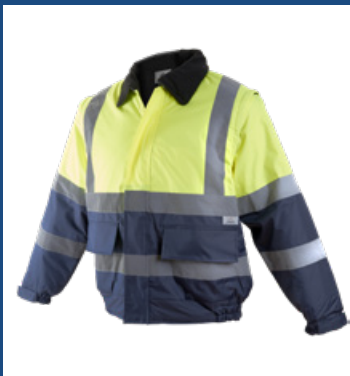
031 Marino/Amarillo AV