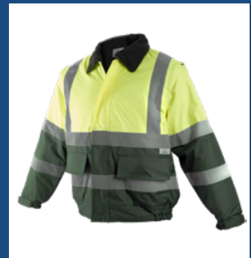
091 Verde oscuro/Amarillo AV