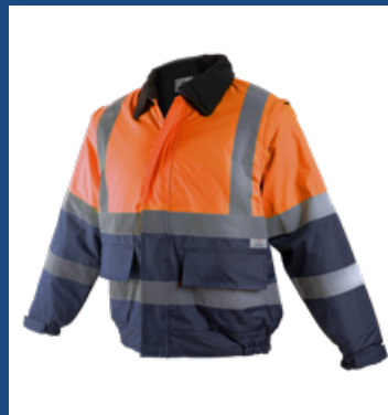
032 Marino/Naranja AV