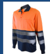
320 Marino/Rojo AV