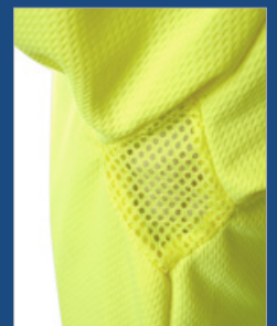
Detalle de las axilas