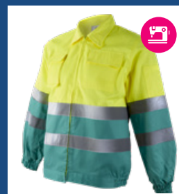
111 Verde claro/Amarillo AV DESCATALOGADO (últimas unidades)

CONFECCIÓN BAJO PEDIDO: Solicítanos información sobre plazos de entrega.