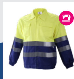
041 Azulina/Amarillo AV