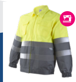
051 Gris/Amarillo AV