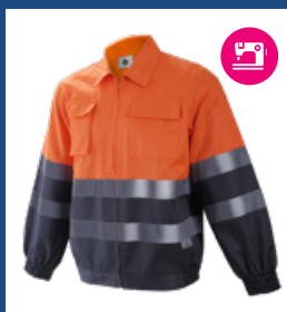
052 Gris/Naranja AV