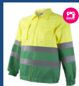
101 Verde medio/Amarillo AV DESCATALOGADO (últimas unidades)