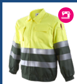
091 Verde oscuro/Amarillo AV DESCATALOGADO (últimas unidades)