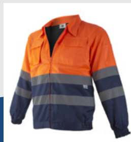
032 Marino/Naranja AV