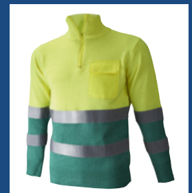
111 Verde claro/Amarillo AV