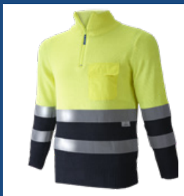
031 Marino/Amarillo AV