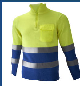
041 Azulina/Amarillo AV