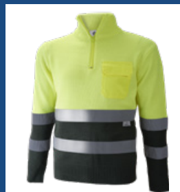
091 Verde oscuro/Amarillo AV