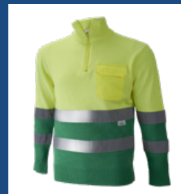
101 Verde medio/Amarillo AV