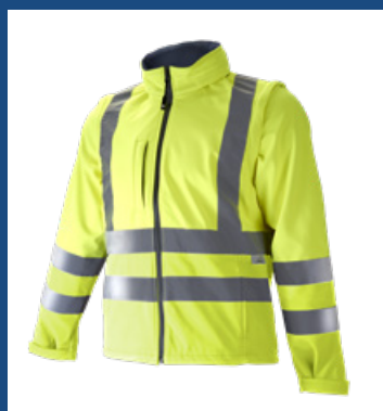
001 Amarillo AV