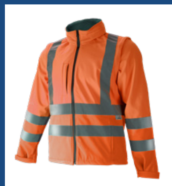
002 Naranja AV