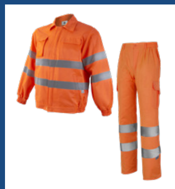
002 Naranja AV