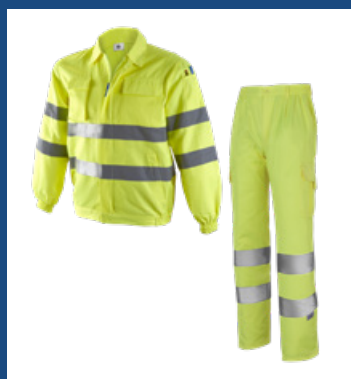
001 Amarillo AV

La Clase 3 de la Norma EN ISO 20471/13+A1/16 solo se alcanza cuando las prendas Ref. 1053 (Cazadora multibolsillos) y Ref. 1052 (Pantalón multibolsillos) del mismo color se usan conjuntamente.