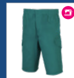
008 Verde DESCATALOGADO (últimas unidades)