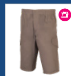
012 Beige DESCATALOGADO (últimas unidades)