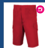
013 Rojo DESCATALOGADO (últimas unidades)

CONFECCIÓN BAJO PEDIDO: Solicítanos información sobre plazos de entrega.