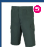
009 Verde oscuro