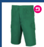
010 Verde medio DESCATALOGADO (últimas unidades)