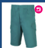
011 Verde claro