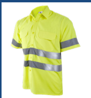
001 Amarillo AV