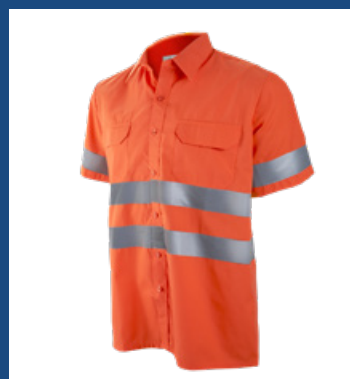
002 Naranja AV