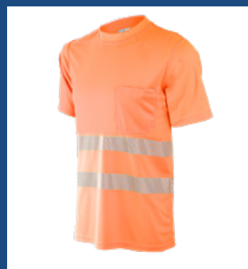
2 Naranja AV