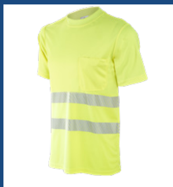
1 Amarillo AV