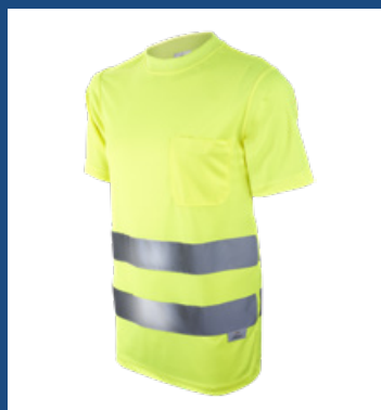
001 Amarillo AV