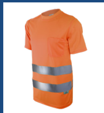
002 Naranja AV