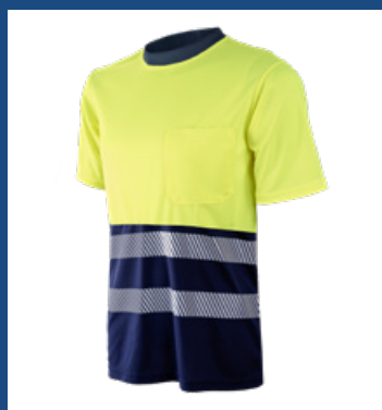
31 Marino/Amarillo AV