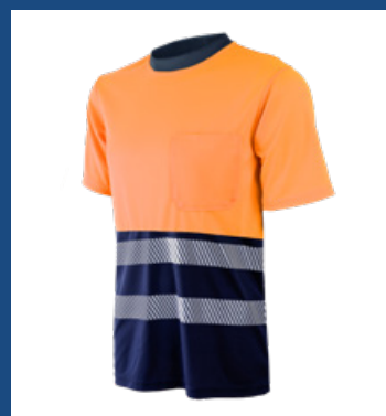
32 Marino/Naranja AV