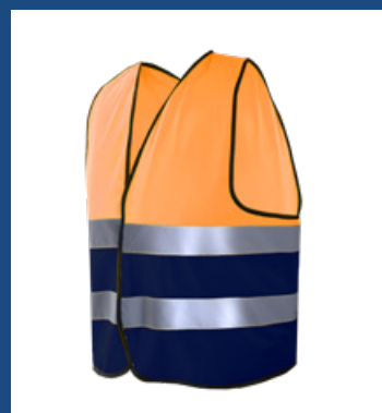
032 Marino/Naranja AV