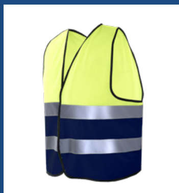
031 Marino/Amarillo AV