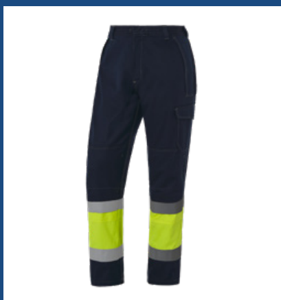
031 Marino/Amarillo AV

Bolsillos para rodilleras con doble atadura que permiten dos opciones de colocación