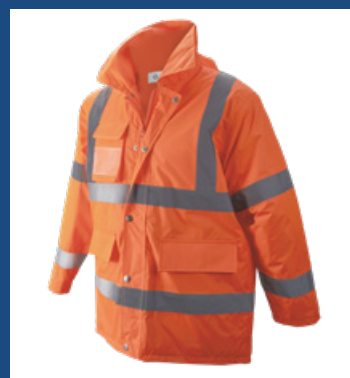
002 Naranja AV