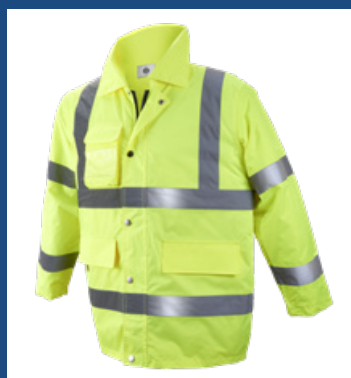
001 Amarillo AV