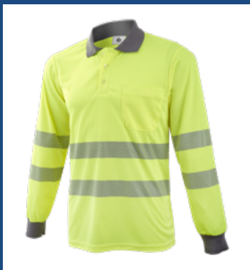
001 Amarillo AV