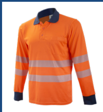
002 Naranja AV