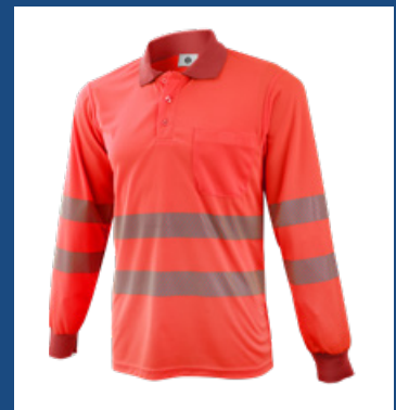
020 Rojo AV