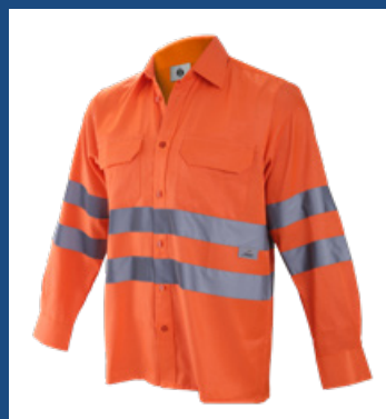
001 Amarillo AV