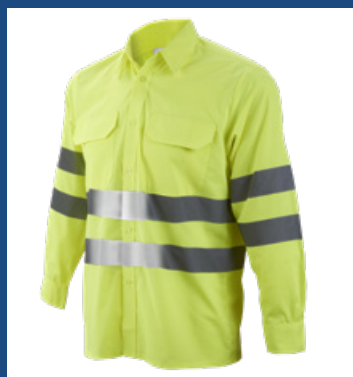
001 Amarillo AV