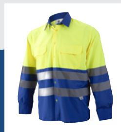
041 Azulina/Amarillo AV DESCATALOGADO (últimas unidades)