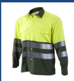
091 Verde oscuro/Amarillo AV DESCATALOGADO (últimas unidades)