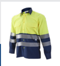
031 Marino/Amarillo AV