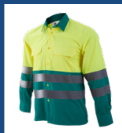
111 Verde claro/Amarillo AV DESCATALOGADO (últimas unidades)