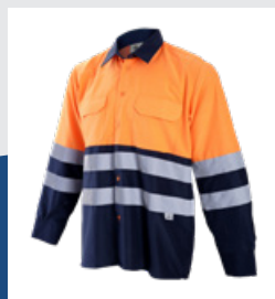
032 Marino/Naranja AV DESCATALOGADO (últimas unidades)