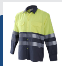
051 Gris/Amarillo AV DESCATALOGADO (últimas unidades)