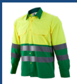
101 Verde medio/Amarillo AV DESCATALOGADO (últimas unidades)