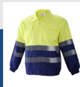
041 Azulina/Amarillo AV