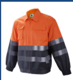
052 Gris/Naranja AV