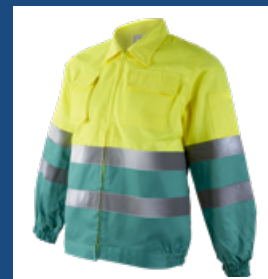
111 Verde claro/Amarillo AV DESCATALOGADO (últimas unidades)