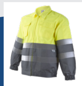
051 Gris/Amarillo AV