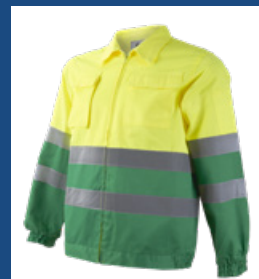
101 Verde medio/Amarillo AV DESCATALOGADO (últimas unidades)