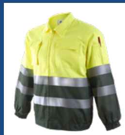
091 Verde oscuro/Amarillo AV DESCATALOGADO (últimas unidades)