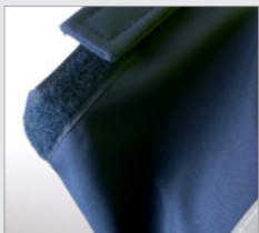
Puños con velcro