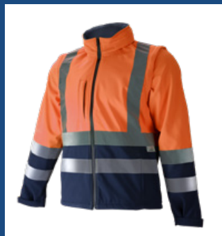
032 Marino/Naranja AV