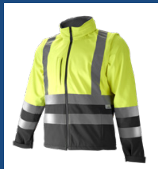
051 Gris/Amarillo AV