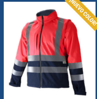
320 Marino/Rojo AV