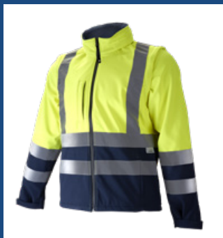
031 Marino/Amarillo AV