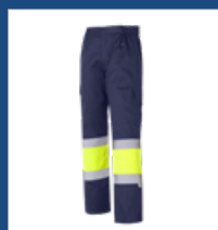
031 Marino/ Amarillo AV