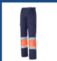
032 Marino/ Naranja AV