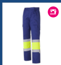
041 Azulina/ Amarillo AV