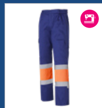
042 Azulina/ Naranja AV DESCATALOGADO (últimas unidades)