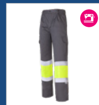
051 Gris/ Amarillo AV