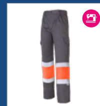
052 Gris/ Naranja AV