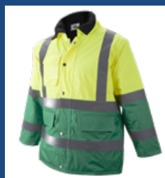
101 Verde medio/Amarillo AV