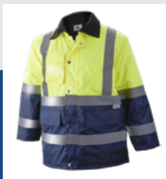
031 Marino/Amarillo AV