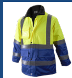
041 Azulina/Amarillo AV