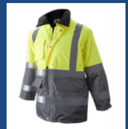
051 Gris/Amarillo AV