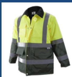
091 Verde oscuro/Amarillo AV