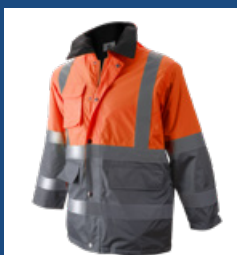
052 Gris/Naranja AV