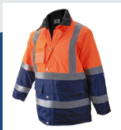
032 Marino/Naranja AV