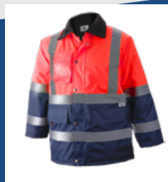
320 Marino/Rojo AV