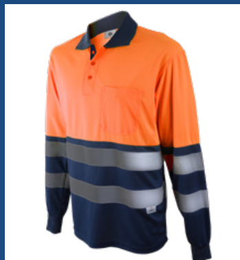
032 Marino/Naranja AV