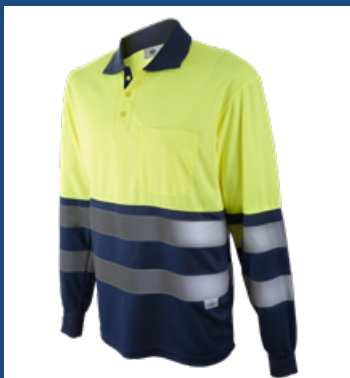
031 Marino/Amarillo AV