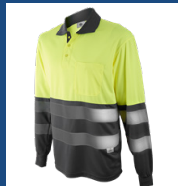
051 Gris/Amarillo AV