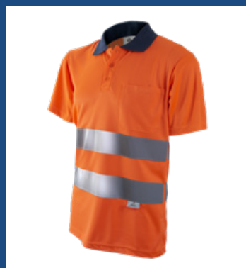
002 Naranja AV