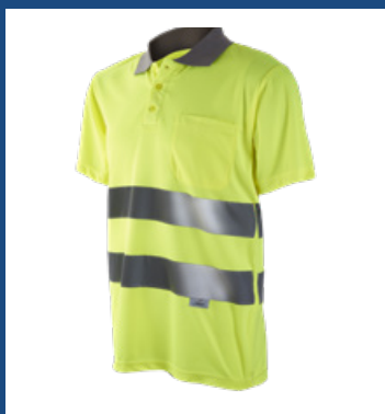
001 Amarillo AV