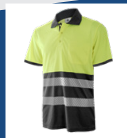
051 Gris/Amarillo AV