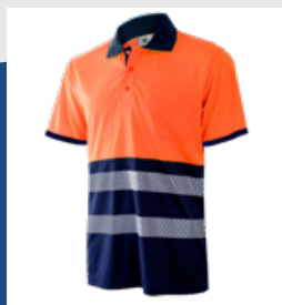
032 Marino/Naranja AV