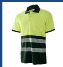
091 Verde oscuro/Amarillo AV