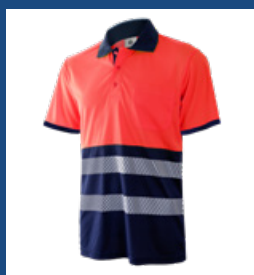
320 Marino/Rojo AV