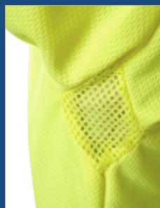
Detalle de las axilas