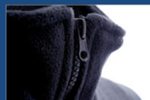
Detalle del cuello