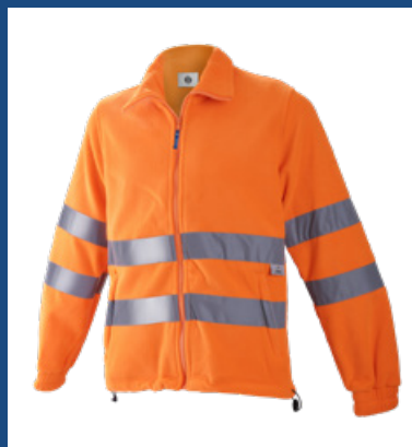
002 Naranja AV