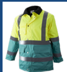
111 Verde claro/Amarillo AV DESCATALOGADO (últimas unidades)