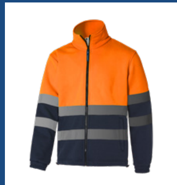
032 Marino/Naranja AV