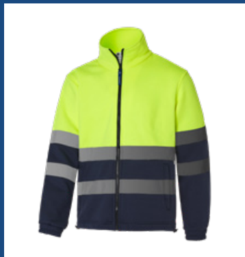
031 Marino/Amarillo AV