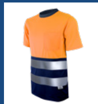
032 Marino/ Naranja AV