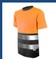
052 Gris/ Naranja AV