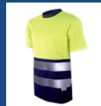
041 Azulina/ Amarillo AV