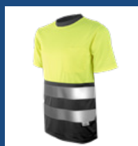
051 Gris/ Amarillo AV