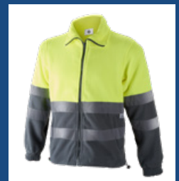
051 Gris/Amarillo AV