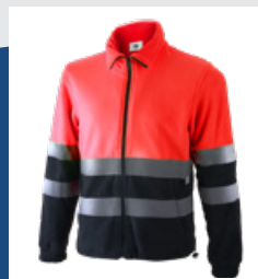
320 Marino/Rojo AV