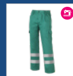
008 Verde DESCATALOGADO (últimas unidades)