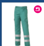
011 Verde claro