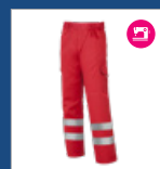
013 Rojo DESCATALOGADO (últimas unidades)