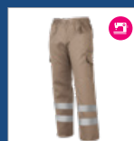
012 Beige DESCATALOGADO (últimas unidades)