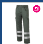
009 Verde oscuro