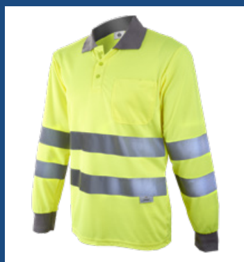
001 Amarillo AV