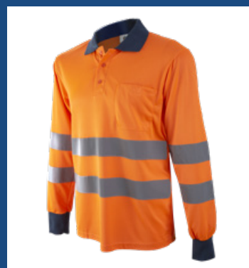
002 Naranja AV