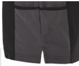
2 bolsillos laterales