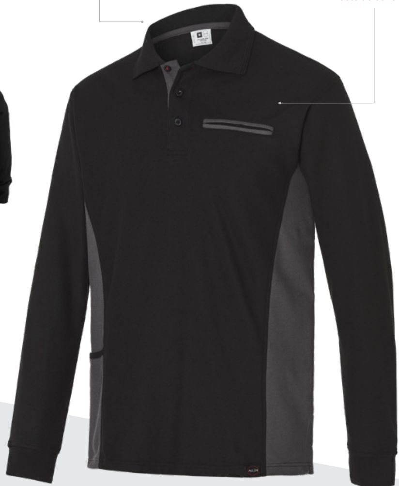
Puños de canalé