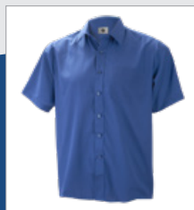
004 Azulina DESCATALOGADO (últimas unidades)