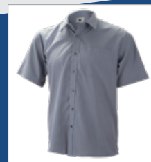
005 Gris DESCATALOGADO (últimas unidades)