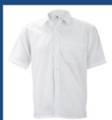
007 Blanco DESCATALOGADO (últimas unidades)