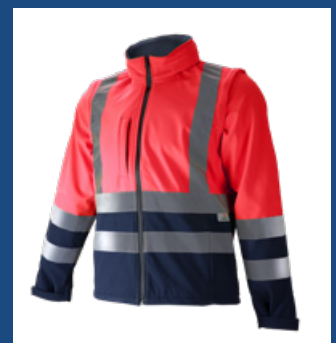
320 Marino/Rojo AV