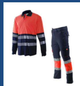
320 Marino/Rojo AV