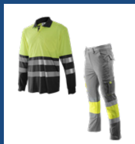
051 Gris/Amarillo AV